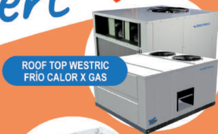
ROOF TOP WESTRIC FRÍO CALOR X GAS