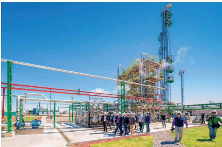
Primer refinería de petróleo pampeana con oleoducto propio en Argentina.