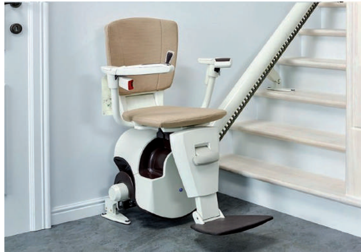
El sistema del rail salvaescalera aporta una solución para personas con movilidad reducida, allí donde no hay espacio para el hueco de un ascensor.

“Ascensores Golovca” siempre se ha dedicado al servicio de modernización y mantenimiento de sistemas,