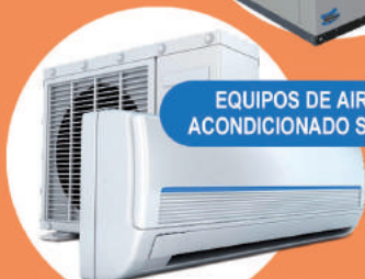
EQUIPOS DE AIRE ACONDICIONADO SPLIT