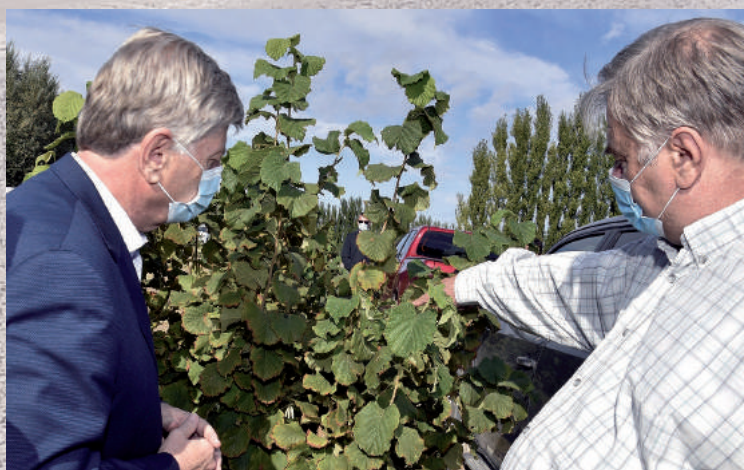
El gobernador Sergio Ziliotto estuvo a fines de febrero en la Vendimia en Casa de Piedra, junto a Enrique Schmidt y su comitiva, donde presentó el proyecto de la bodega boutique en la que la Provincia invertirá más de $ 1.000 millones.

Al ser consultado Enrique Schmidt sobre su participación en la Mesa Vitivinícola, destacó que se fomenta “un acompañamiento para una futura ruta del vino, que aporta para la gastronomía, con otro producto local que suma mano de obra”. Además, destacó el “avance importante” para la producción que representa la construcción de una bodega provincial.