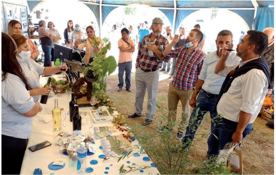
En la recorrida de autoridades por la Muestra en la jornada inaugural, hubo degustación de vinos pampeanos en el stand del EPRC. Consultados los visitantes sobre que variedad probar, eligieron Cabernet.