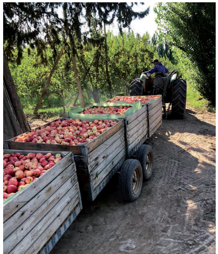
Producción de frutas, hortalizas y otros cultivos en chacras de la zona.