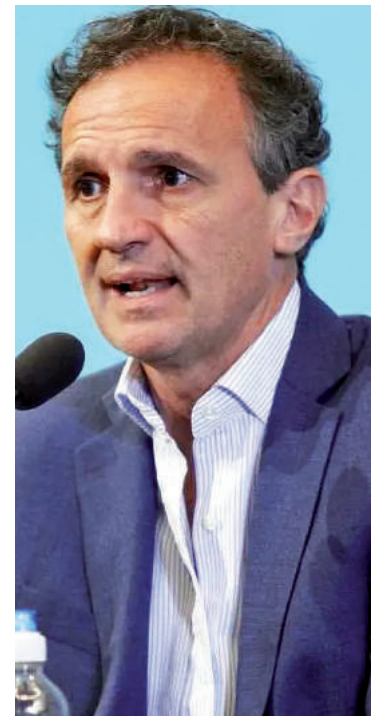
Gabriel Katopodis, ministro de Obras Públicas de la Nación.

se ejecuten las obras, para hacer realidad promesas incumplidas.