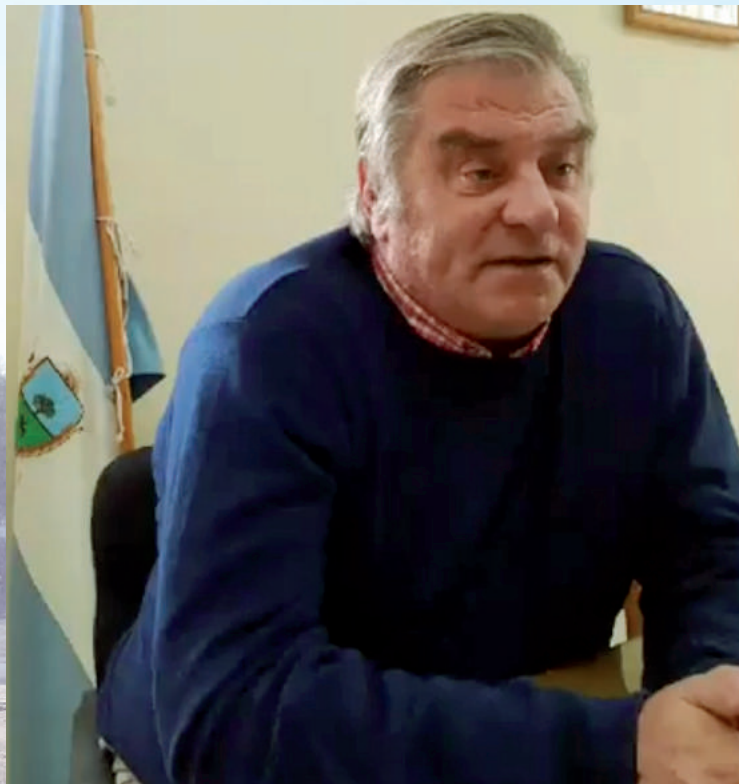
Schmidt destacó que a pesar de la preocupación por la crisis hídrica mundial, la última cosecha de vides marcó un récord para la Provincia.

De acuerdo a los caudales de agua indicados y autorizados por el Comité Interjurisdiccional del Río Colorado (COIRCO) y