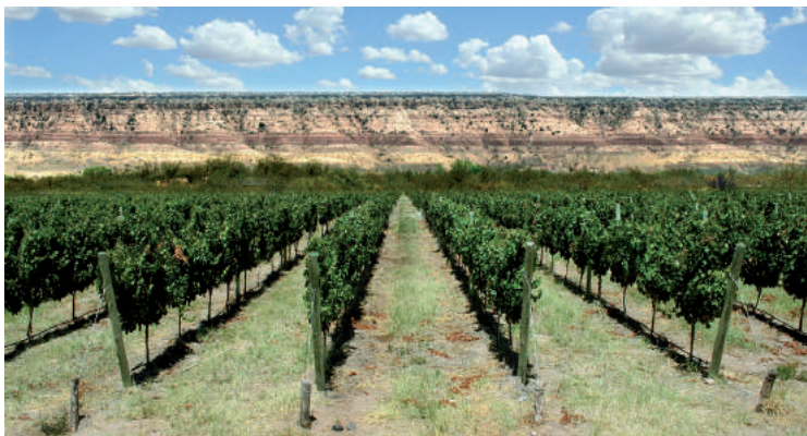
Excelentes viñedos junto al río en la ruta de los vinos de zonas frías.

La Producción en el Secano y Bajo Riego, como bien dice la ‘Canción a 25’, llena de esperanza a sus habitantes y también plantea grandes desafíos para saber utilizar este presente y garantizar un futuro próspero. Es el deseo de sus pobladores “que nuestros hijos se sientan dueños de cuidar como emprendedores de nuevas alternativas, el desarrollo de un 25 que avanza...”