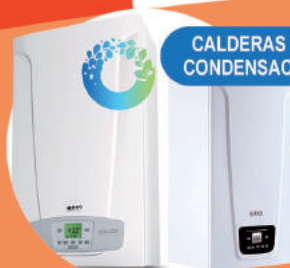
CALDERAS DE CONDENSACIÓN