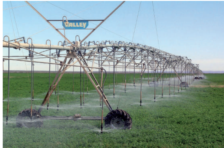
Cosecha de alfalfa sembrada bajo el sistema de riego por pivotes centrales.

Sin embargo, la tenacidad de quienes vinieron para quedarse no se hizo esperar y entre la desazón de aquellos días volvieron a apostar a 25 y a refundarlo prácticamente, por eso sus habitantes