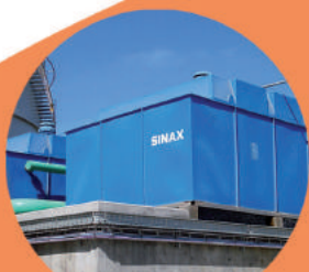
TORRE DE ENFRIAMIENTO SINAX.

Somos una empresa especializada en la comercialización de equipos de aire acondicionado y calefacción. Ofrecemos productos de alto rendimiento y calidad asegurada.