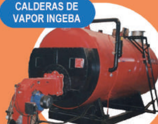
CALDERAS DE VAPOR INGEBA