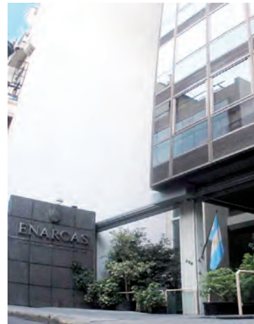
que pudieran ocasionarse en el transcurso de dicha ejecución.

El Ente Nacional Regulador del Gas (ENARGAS) informa que, por medio de la Resolución 219/2022, instruyó a las Licenciatarias del Servicio Público de Distribución de Gas por redes a crear la Base Unificada Nacional de Instaladores Matriculados y Matriculadas de la República Argentina, en el marco de la responsabilidad y obligaciones que les caben a las Distribuidoras respecto de la matrícula de los instaladores en el marco de los Anexos XXVII de los Contratos de Transferencias.