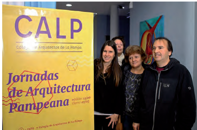
Las "Jornadas de Arquitectura Pampeana" se iniciaron en junio de 2017 (foto de archivo), a fin de este mes el CALP desarrollará su 6ª Edición consecutiva.

Al cierre de esta edición, se realizaba en el edificio del Registro Civil y Juzgado de Paz de General Pico, el acto público de premiación y exposición del Concurso Provincial de Anteproyectos "Plan Maestro y urbanización de 44.5 hectáreas en la ciudad de General Pico", organizado por el Colegio de Arquitectos de La Pampa (CALP), tras el llamado del Instituto Provincial Autárquico de Vivienda (IPAV), donde tras la apertura de sobres develarían el nombre de los ganadores.