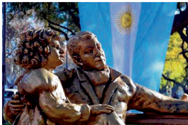
Escultura de San Martín, sentado en un banco del paseo de la Alameda en Mendoza, junto a su hija, Merceditas. En 1986 en Mendoza, la Legislatura sancionó la ley 5.131, la cual establece al 24 de agosto como el Día del Padre Sanmartiniano, fecha que se intentó que fuera ley para consagrar el "Día del Padre Argentino" pasando por el Congreso Nacional, pero las costumbres y los negocios impidieron lograrlo y se sigue celebrando en junio