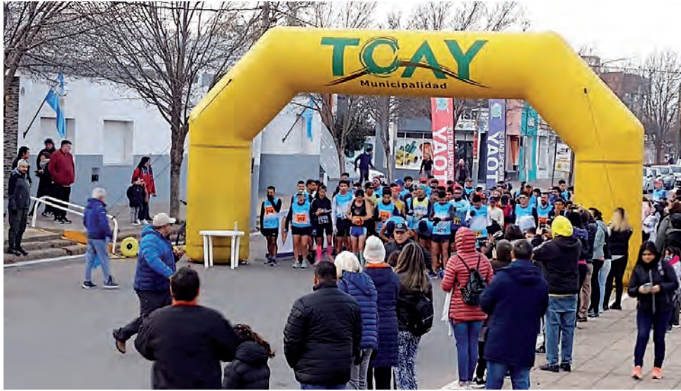
La Media Maratón "Ramon Gómez" formó parte de los festejos por el 128º Aniversario de Toay y contó con la participación de unos 200 inscriptos.