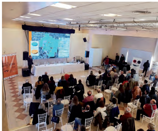
Con muy buena participación, el CALP tuvo como eje valorizar el ejercicio de la planificación urbana y territorial.

localidad (...) la Provincia de La Pampa con sus organismos de gobierno realiza una transformación muy grande en los municipios en cada intervención que hace y creemos que somos una de las patas fundamentales en este organigrama", señaló Buffa.