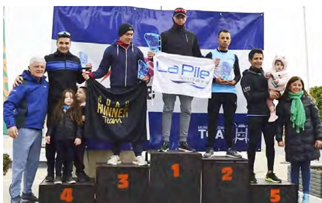
Podios de la jornada Media Maratón 128° Aniversario