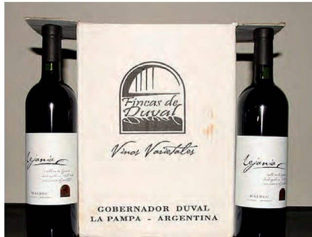
Vinos de la bodega "Lejanía" de la localidad pampeana de Gobernador Duval, varias veces premiados.