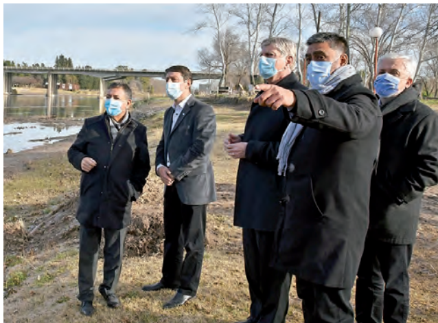
Intendente municipal Juan Barrionuevo con el gobernador Sergio Ziliotto y parte de la comitiva que lo acompañó.

"Venimos a traer soluciones, pero fundamentalmente a cumplir promesas", afirmó el gobernador Sergio Ziliotto en La Adela, donde encabezó la inauguración de las obras del sistema de desagües cloacales y agua potable, en las que se invirtieron más de $ 420 millones. Durante su