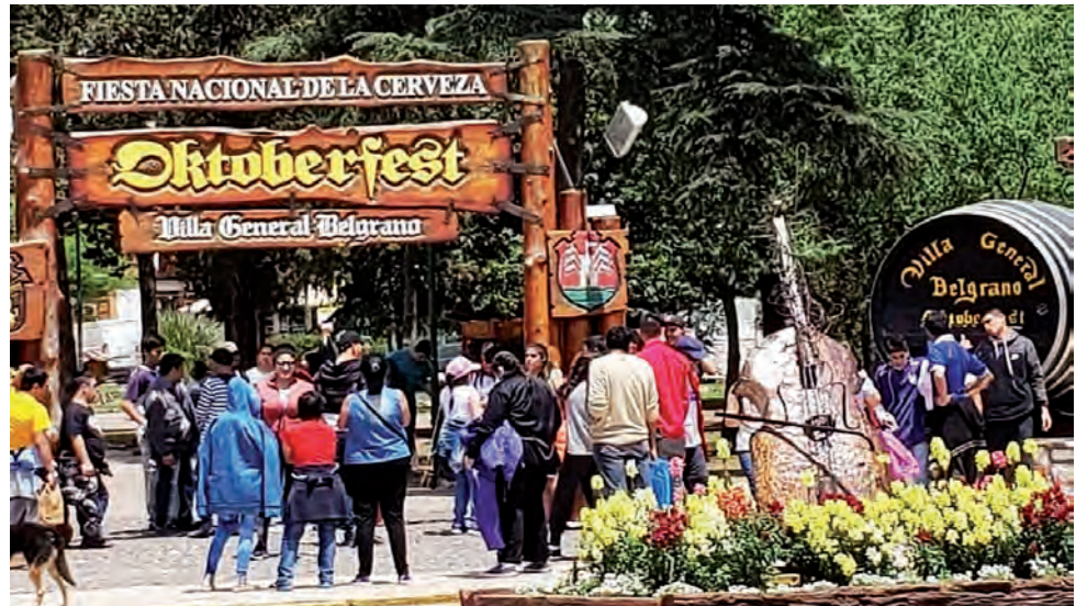
Hoy en día más de 125.000 propiedades en todo el mundo cuentan con el sello visible de "Viajes Sustentables" de Booking.com en su perfil dentro de la plataforma.

De hecho, de acuerdo a una investigación de Booking.com, líder digital cuya misión es hacer que conocer el mundo sea más fácil para todos, el 88% de los argentinos afirma que viajar de forma sustentable le resulta importante y un 74% quiere viajar de forma más sustentable en los próximos 12 meses.