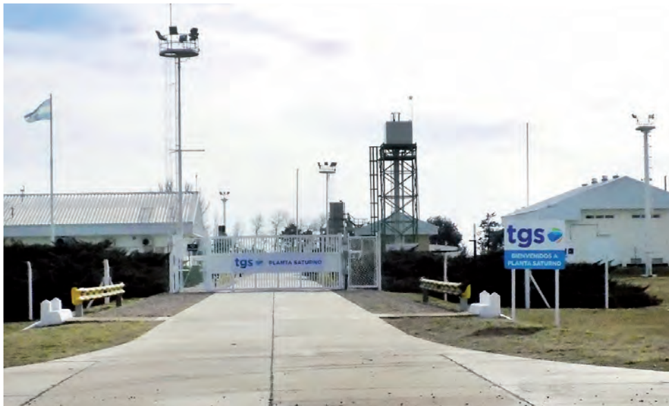
En Salliqueló (BA) la empresa Transportadora Gas del Sur (TGS) tiene la planta compradora "Saturno". Hasta allí llegará la 1ra Etapa del Gasoducto NK que viene desde Neuquén y atraviesa La Pampa pasando por Casa de Piedra, Chacharramendi y Doblas.

Los contratos corresponden a la construcción de las obras civiles y complementarias de su primer tramo de 583 kilómetros de extensión, proyectado para conectar la Planta de Tratamiento de gas de Tratayén (provincia de Neuquén) con la planta de Compresión de gas de Salliqueló (Buenos Aires).