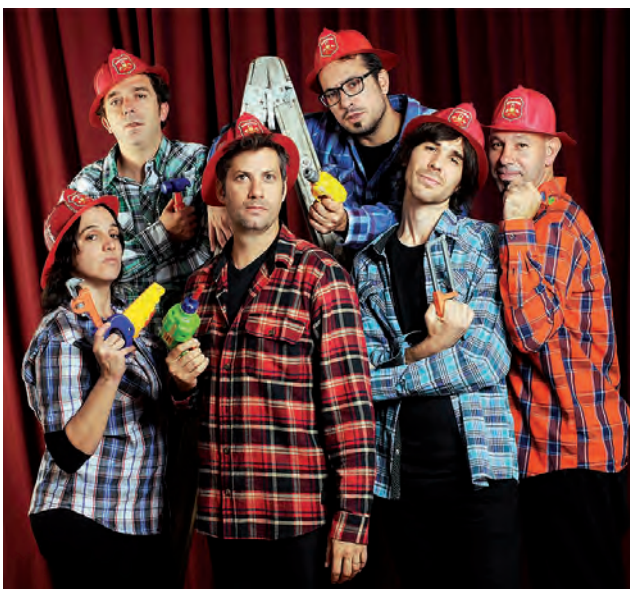
La Banda de Rock Infantil "Los Raviolis" estará presente con su show de ingeniosas canciones para toda la familia.

La Municipalidad de Santa Rosa invita a toda la comunidad a disfrutar del festejo del "Día de las Infancias", que tendrá lugar en el Parque Don Tomás el próximo domingo 28 de Agosto, proponiendo desde las 14 horas un completo y variado programa de actividades y shows gratuitos para toda la familia, que se extenderá hasta aproximadamente las 20 horas.