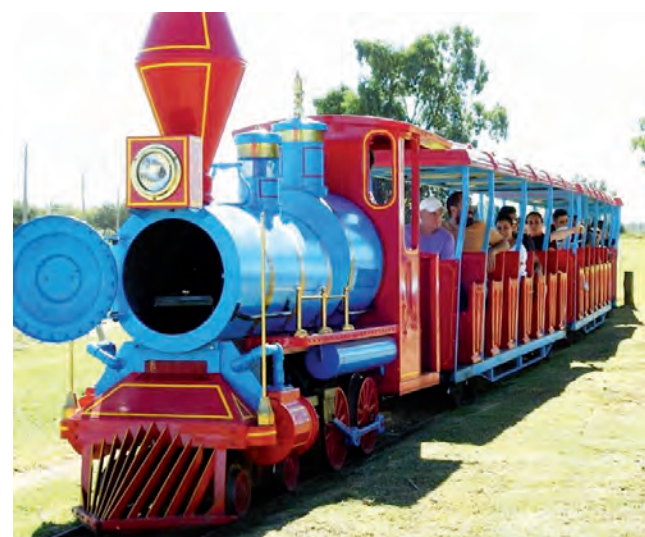
Durante toda la jornada funcionarán los trenes Puelchito y Pamperito, llevando y trayendo gente desde y hacia el Castillo de la Isla de los Niños.