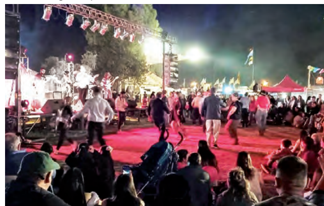
El Patio Gastronómico de esta edición, todo un éxito.