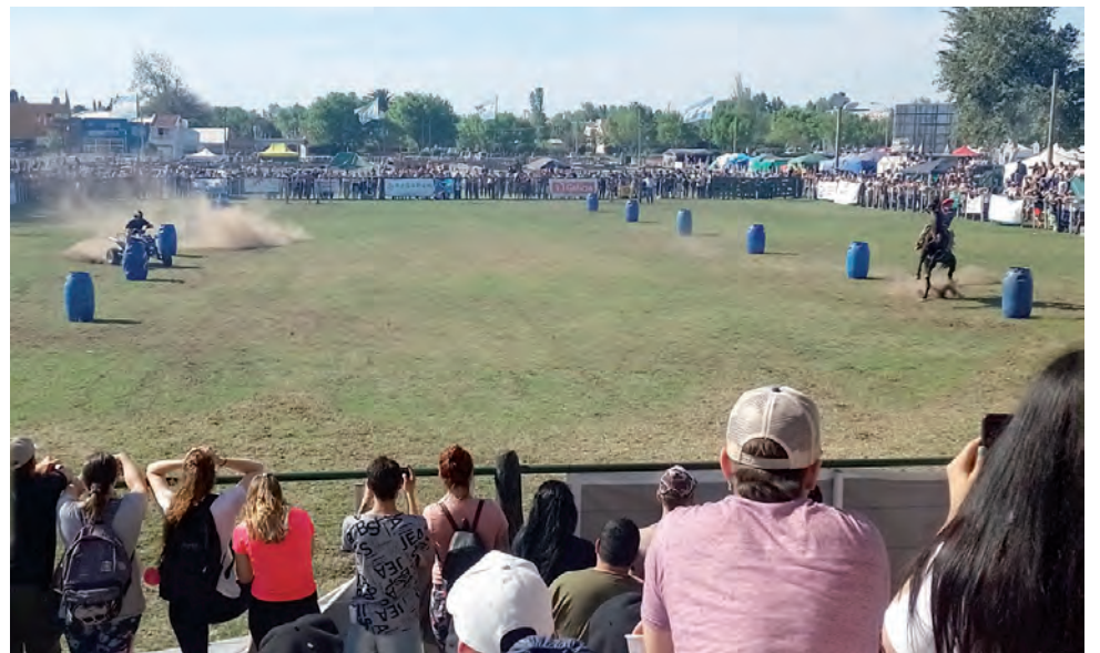
En la Pista Central fue muy convocante las competencias con obstáculos de moto y cuatriciclos versus caballos, donde los equinos y muy buenos jinetes se llevaron la mejor parte.

El sábado fue el turno de las autoridades nacionales, provinciales y municipales, que recorrieron la muestra y participaron de la inauguración oficial. Por su parte, la pista central fue receptora del des-