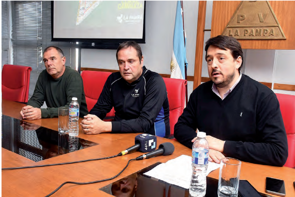
La prueba pedestre "camino a los 70 años" se llevará a cabo sobre las avenidas Spinetto, Luro y Circunvalación, el sábado 15 de octubre, con participación gratuita, abierta para todo público, incluyendo una Correccaminata Kids. Inscripción: dpv.lapampa.gov.ar