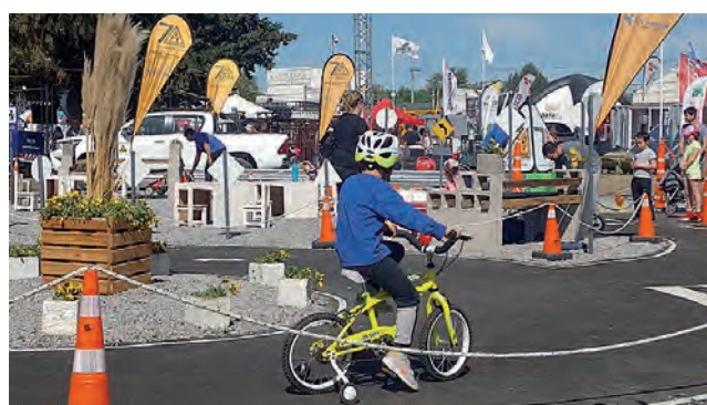
Stand de la DPV que recibió Mención Institucional.