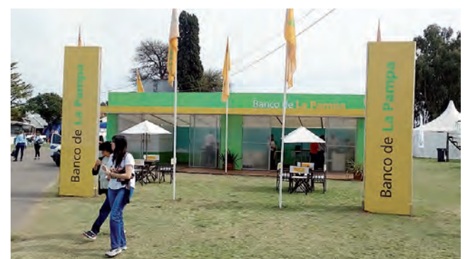
Stand del BLP que recibió Mención Institucional.