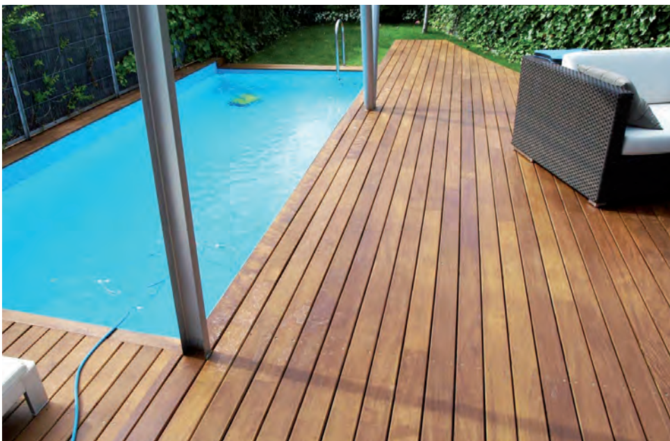
Las nuevas tendencias en el comportamiento están llegando con propuestas que nos invitan a disfrutar aún más de los espacios exteriores, que nos conectan con la naturaleza.

Otro modo de llevar el interior al afuera es tener barras en los balcones. Estas no solo son ideales para compartir comidas, tragos y hasta un mate. También nos animan a trabajar o estudiar de cara al sol.