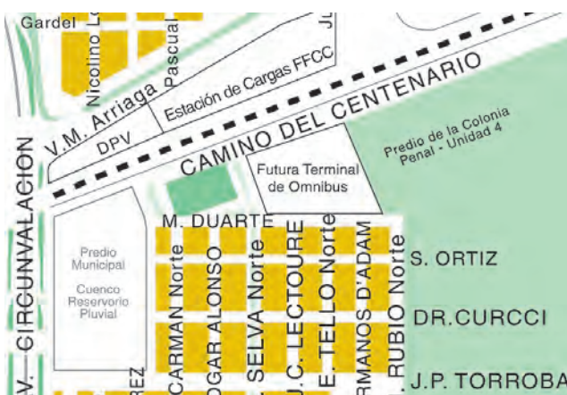
El predio está delimitado por la Av. del Centenario al Norte, calle Duarte al Sur, predio de la Colonia Penal al Este y lindando al Oeste con el cuenco de desagües pluviales. (Sección 2 - Fracción D - Lote 13 - Parcela 220)

y Corrientes, aparte de no cumplir con las condiciones de prestación de servicios, entorpece el tránsito con el ingreso y egreso de grandes unidades de transporte que hasta se les dificulta circular por la apretada trama urbana céntrica.