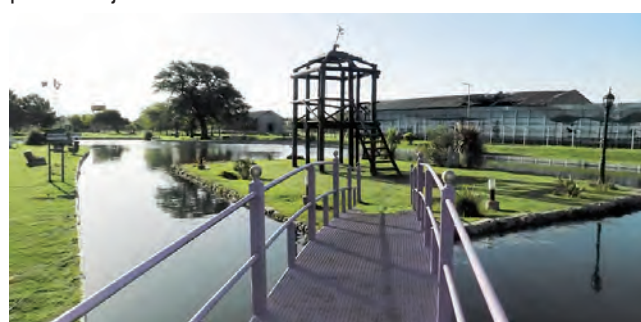
"Paseo del Lago", una obra que distingue a Calefú.