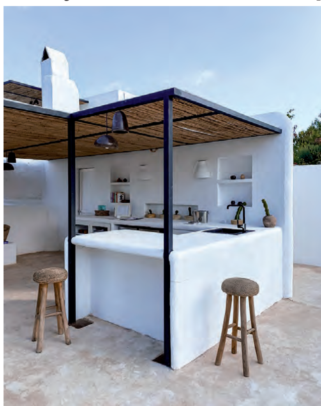
La madera aparece como un gran recurso para la transición y Cetol comparte tips para su correcta protección.

Así, los bancos de madera rústica o de prolijos listones combinados con estructura de hierro se pueden ver alrededor de los grandes fogones. Pero no son lo único que busca dar nuevos usos a los exteriores.