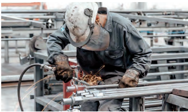
La decisión es que las Pymes industriales de La Pampa paguen salarios, no impuestos.

Esta nueva medida refuerza la política productiva del gobernador Sergio Ziliotto, de incentivar la generación de trabajo pampeano, disminuyendo fuertemente o eliminando, la presión impositiva al sector y dotando a sus PyMEs de ventajas ante competidores de otras provincias. Los créditos fiscales se otorgan por el monto total de la nómina salarial que mensualmente abonen a sus empleados y servirán para cancelar impuestos provinciales que gravan su actividad, incluyendo además del impuesto sobre los Ingresos Brutos, a Sellos, Inmobiliario y Vehículos. A partir del 1º de noviembre, las PyMEs industriales de La Pampa comenzaron a acceder a dichos incentivos fiscales a través de un novedoso sistema web del Gobierno provincial que permite la tramitación online de los créditos fiscales destinados a generar y sostener el empleo industrial pampeano.