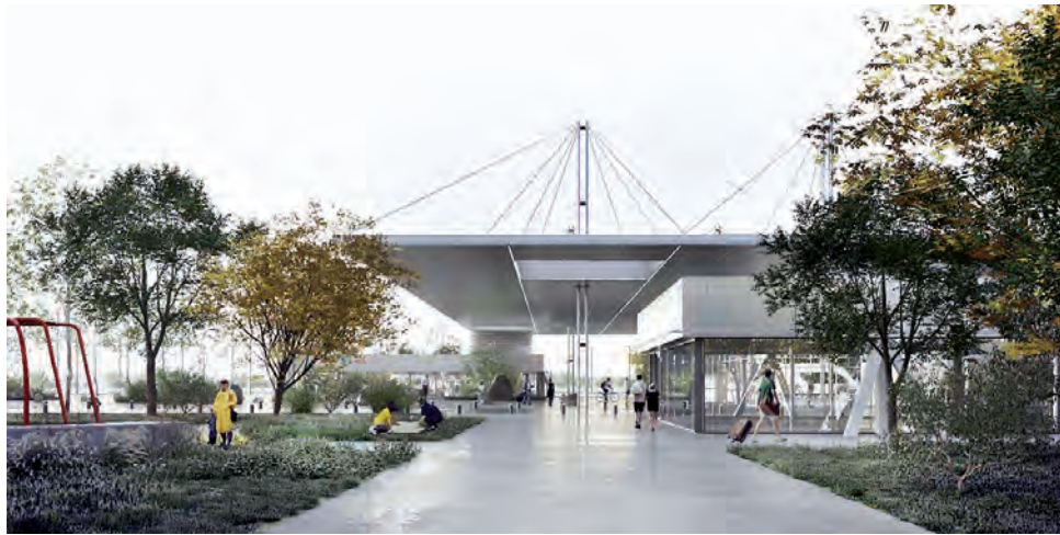
La obra se caracteriza por tener un importante perfil paisajístico, con parque, plaza, plazoletas y un Paseo Comercial, todo integrando un corredor verde que atenúe el impacto del movimiento intensivo de la Terminal, dándole un entorno moderno y ecológico.

Finalmente, luego de tantas administraciones provinciales y municipales llenas de proyectos y promesas que nunca cumplieron, la actual gestión de Sergio Ziliotto al frente del Gobierno Provincial y de Luciano di Nápoli en la Comuna capitalina, se hace tangible la anhelada -y muy necesaria- obra de la nueva Terminal de Ómnibus de Santa Rosa, con una inversión -que a la fecha de la licitación anticipada para el 30 de este mes-, contempla un monto aproximado a los $ 3.600 millones.