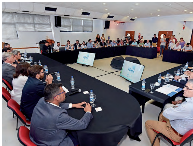
VIENE DE TAPA