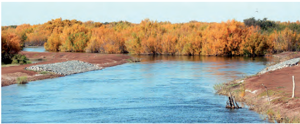
Alguna vez, hubo agua en nuestro Oeste Pampeano, a veces un poquito y nunca demasiado. Esta foto captada por REGION® en abril de 2007 es apenas un testimonio de 15 años atrás. Chela Gentile escribía "No lo atajen al río y no lo frenen, déjenlo suelto, el buscará su cauce y así sabremos quién es el dueño".

Gerónimo de Bibar (1552) Gerónimo de Bibar, compañero de Pedro de Valdivia, envió a Francisco de Villagra o Villagrán a explorar la zona de Cuyo. Villagra recorrió el río Diamante, afluente del Atuel y exploró el valle de éste último, luchando contra un grupo de puelches en el Pucará del Atuel. Esto ocurría en 1552 (Bibar, Crónica y relación copiosa y verdadera de los reinos de Chile . . .).