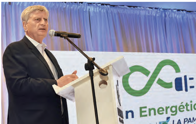
Gobernador Ziliotto en el acto realizado en Winifreda.