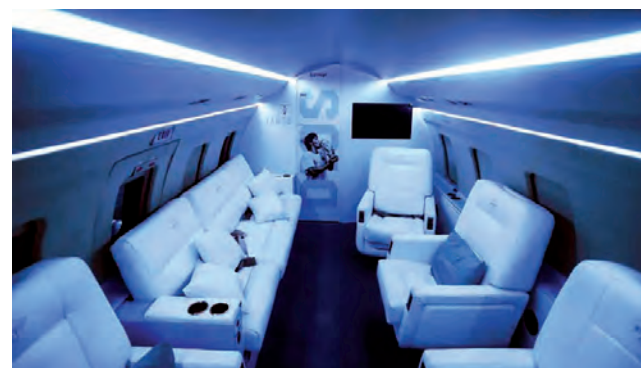
Interior del avión Tango D10S.