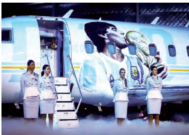
El Give&Get Fanfest de Diego Maradona recibe 120.000 personas de todo el mundo y una exposición mediática global sin precedentes.

El Mundial de Futbol 2022 es el primero sin la presencia de Diego Maradona. Sin embargo y para la alegría de los fans, la gran nación de Qatar facilitó los recursos para crear el Give&Get Fanfest de Diego Maradona. Este espacio utiliza tecnología de última generación dándole una nueva vida a Diego, de modo que todos los visitantes podrán interactuar con él. El Give&Get Fanfest de Diego Maradona abre sus puertas diariamente durante todo el Mundial de Qatar, ofreciendo múltiples atracciones, eventos y actividades que tendrán como eje principal la figura de Diego.