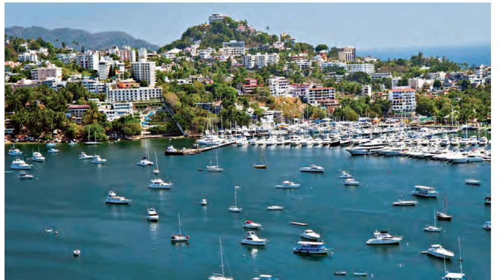
Acapulco, Mazatlán y Puerto Vallarta, son tres destinos destacados de la Costa Oeste mexicana, bañados por el Océano Pacífico, cada uno con características especiales.

den ingresar a México sin necesidad de tramitar una visa y permanecer en el país por 180 días en calidad de turista solo con un pasaporte vigente.