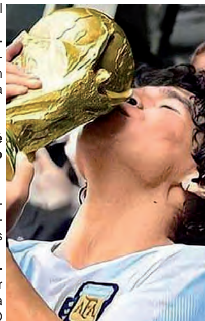
Una escena que todos esperamos que se repita, ahora con los nuevos protagonistas de nuestro tiempo.

Subasta pública Y finalmente el 17 de diciembre se hará la subasta pública de todo lo donado por sus herederos y deportistas famosos de todo el mundo y se podrá admirar la colección de camisetas originales autenticadas que fueron prestadas para el evento.