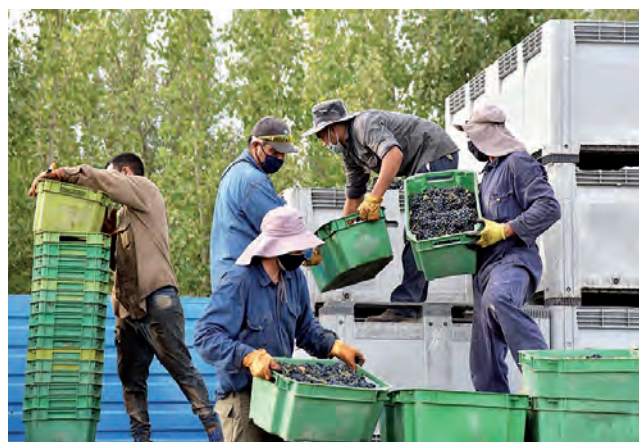
Las medidas serán presentadas por el propio Gobernador ante inversores, empresarios y productores, durante una misión de inversores que visitará Casa de Piedra en el transcurso de la Vendimia pampeana.

Entre los ítems se incluyen más facilidades para compra de tierras con disponibilidad de agua para riego, créditos con fuerte subsidio de tasas, asignaciones económicas por cada nuevo empleo generado, incentivos fiscales que neutralizan la carga impositiva por hasta 10 años, garantías del FoGaPam de hasta 65 millones de pesos a valores actuales, costo del agua subsidiado durante el período de maduración de la plantación, la construcción de viviendas para la radicación de trabajadoras y trabajadores y la disponibilidad de terrenos con infraestructura para viviendas del personal.