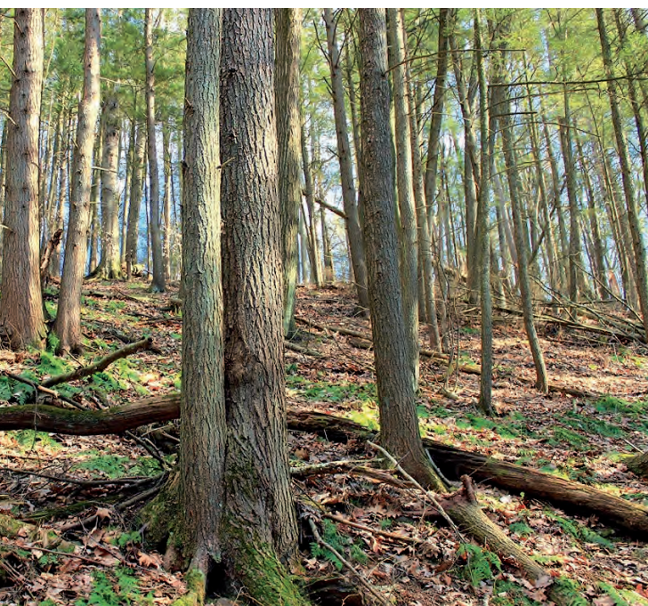
patrimonio de 1,3 millones de hectáreas de plantaciones forestales, con sellos por gestión sostenible reconocidos internacionalmente.