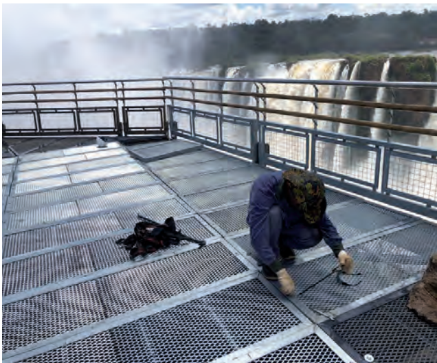
Se analizaron pilas de hormigón armado, pasarelas, barandas y también el balcón sur de uno de los recorridos más imponentes del país.