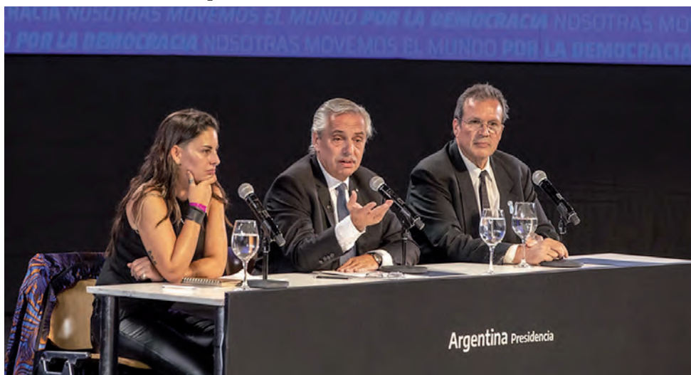
El presidente de la Nación, Alberto Fernández; la ministra de las Mujeres, Géneros y Diversidad de la Nación, Ayelén Mazzina; y el ministro de Cultura de la Nación, Tristán Bauer; dieron inicio en CABA a la cuarta edición de "Nosotras Movemos el Mundo...".

La cuarta edición nacional que se realizó durante la semana que pasó en CABA, en el Centro Cultural Kirchner y en Tecnópolis, se extiende, por primera vez, a cinco provincias: del 10 al 12 de marzo se desarrollará en La Rioja capital; Santiago del Estero capital; Santa Rosa, provincia de La Pampa; y Caleta Olivia, provincia de Santa Cruz; y el 29 de mar-