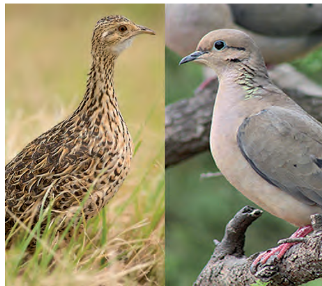
No se podrá cazar aves, palomas y perdices en toda la Provincia. El resto de las especies no están afectadas.

Como informamos la semana pasada, el 1º de marzo dio comienzo en La Pampa la Temporada de Caza 2023 Mayor y Menor, en todas sus modalidades y también -desde febrero- la Temporada de Pesca.