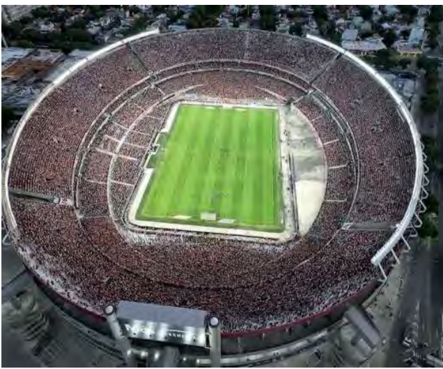
La ciudad de Buenos Aires también aparece en el top 3 de los argentinos junto a Barcelona y Madrid.

El fútbol es pasión de multitudes y aparece en los distintos estudios como un motivo para emprender un viaje. De hecho las camisetas de clubes o selecciones nacionales suelen formar parte de las prendas elegidas a la hora de armar la valija.