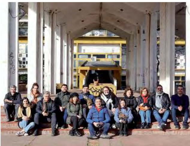
VIENE DE TAPA

El curso de fotografía, uno de los principales atractivos de las jornadas, constó de 4 clases virtuales que se llevaron a cabo todos los jueves del mes de julio. Los/as participantes tuvieron la oportunidad de adentrarse en el mundo de la fotografía de arquitectura, guiados por la experiencia y conocimientos de Gonzalo Viramonte.