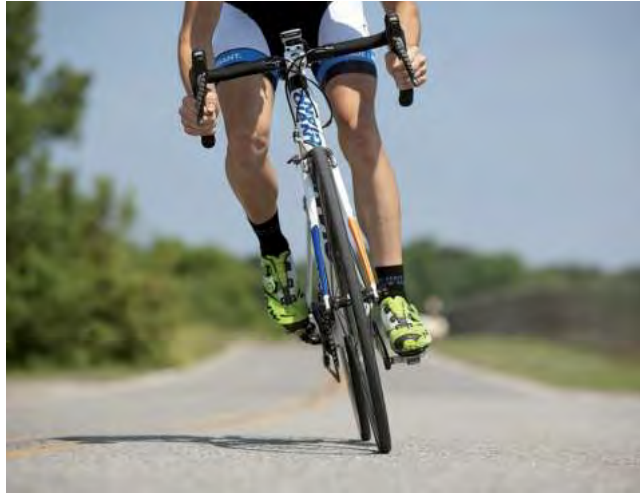
Andar en bicicleta es un excelente entrenamiento cardiovascular que presenta un bajo riesgo de lesiones y reduce el riesgo de infarto.

Cada vez son más las personas en todas partes del mundo que eligen utilizar la bicicleta como principal medio de transporte. Ya sea para fines deportivos, para evitar grandes congestiones de tránsito, para ahorrar o incluso solo para momentos de esparcimiento y recreación, son múltiples los favores que conlleva el uso de la bicicleta.