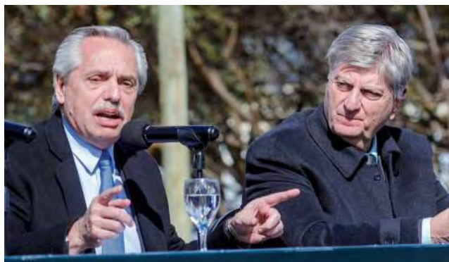
Pocos días antes del aniversario de la UNLPam, el presidente de la Nación inauguró un edificio de aulas y auditorios del Centro Universitario en Santa Rosa.

El proceso creativo de la UNLPam se cumplió ceñidamente entre el 27 de agosto de 1958 y el 4 de septiembre del mismo año. En la Primera fecha fue dictado el Decreto por el que se manda proyectar un instituto universitario en La Pampa.