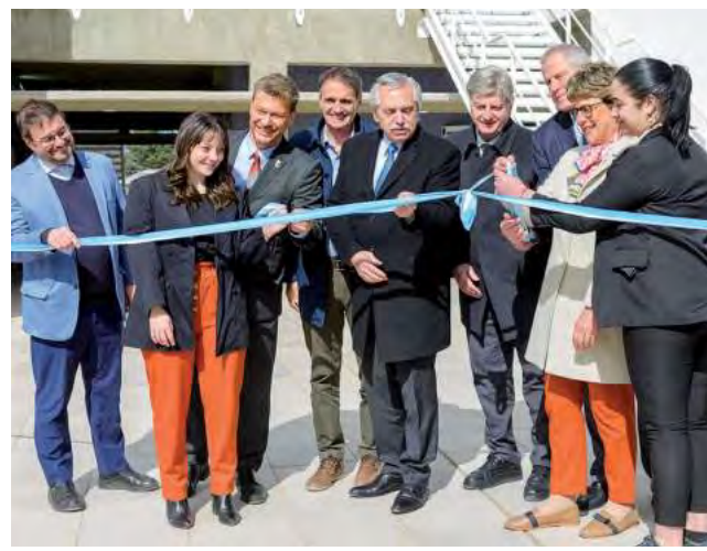
El nuevo edificio de la UNLPam está ubicado en el campus a la altura del kilómetro 334 de la Ruta Nacional 35.

El gobernador Sergio Ziliotto y el presidente Alberto Fernández encabezaron el acto de inauguración del edificio de aulas y auditorios del Centro Universitario de la Universidad Nacional de La Pampa en Santa Rosa. "Abrir las puertas de un nuevo edificio universitario, en tiempos de una desvalorización de la trascendencia estratégica de la universidad pública, es un enorme orgullo", aseguró el gobernador. Por su parte, el presidente Alberto Fernández, defendió el rol del Estado y su intervención en la educación pública.