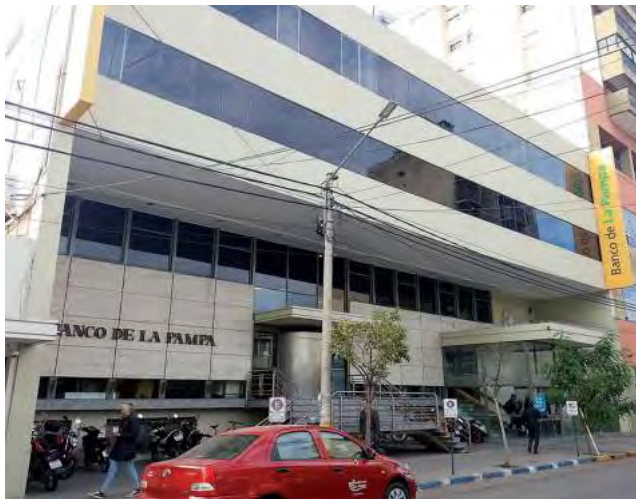
La tasa del 54% TNA, el plazo de hasta 24 meses y el no contar con comisión de originación, resultó en una opción muy accesible.

La tasa del 54% TNA, el plazo de hasta 24 meses y el no contar con comisión de originación, resultó en una opción muy accesible para las más de 25.000 personas clientas que solicitaron la financiación. El monto máximo estipulado fue de $400.000, mientras que el promedio de las operaciones fue cercano a los $375.000. De esta manera, la demanda de créditos personales se incrementó en diez veces según lo registra-