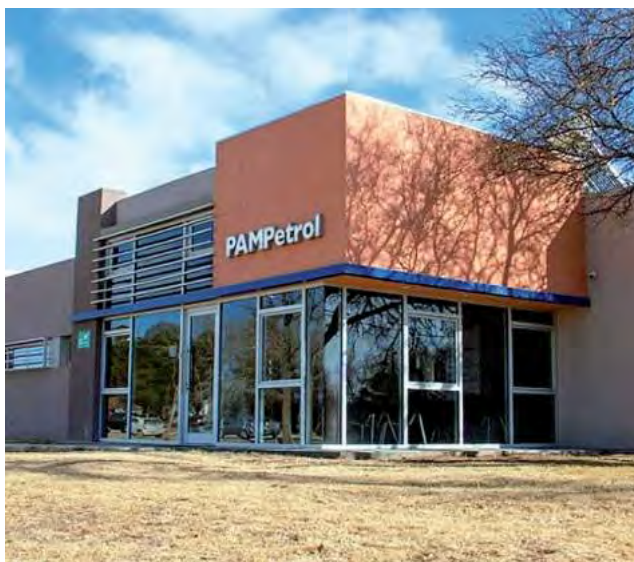
La empresa estatal Pampetrol, en su último balance arrojó un resultado positivo de casi $ 1.200 millones.

En 2015, durante una reunión de la Comisión de Legislación General de la Cámara de Diputados de La Pampa, se emitió el despacho unánime aconsejando la aprobación de una Ley que promulgara la celebración del "Día del Petróleo de La Pampa", en la fecha 5 de septiembre de cada año.