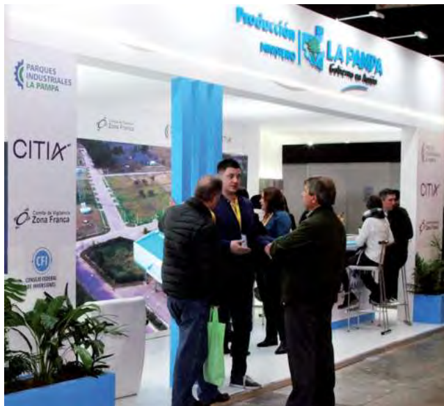
En la actualidad, 24 localidades de La Pampa cuentan con Parques o zonas Industriales, consolidados o en formación.

En cuanto al perfil de empresas radicadas en los parques