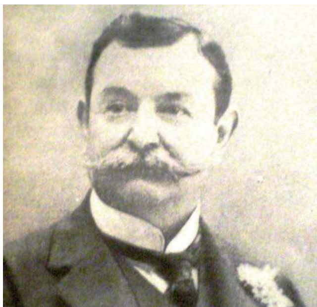
Cada 29 de agosto, desde 1901, se celebra en todo el país el "Día del Árbol", a instancias de Estanislao Zeballos.

De ésta manera, el diario "La Capital" del 18 de octubre de 1902, concluía su crónica referida a la primera "Fiesta del Árbol" celebrada en Santa Rosa de Toay, seis días antes. El programa del festejo incluyó los habituales discursos, diálogos, declamaciones, cantos y