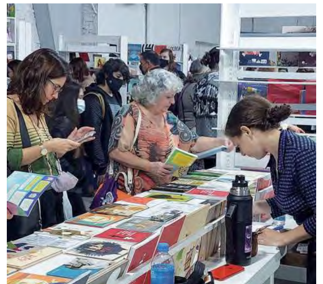
La representación pampeana está a cargo de 7Sellos Editorial, Arte Propio, Mundos Librería (Realicó), Revista HB, Rayuela Librería y encuadernadoras de General Pico.

Con grandes novedades para chicos y jóvenes, cerca de 50 editoriales participan de esta nueva edición de la Feria Provincial Infantil y Juvenil en General Pico, que comenzó el jueves 31 y continuará hasta el sábado 2 de septiembre en el Viejo Galpón (Calle 17, N° 560) de 9 a 20 hs.