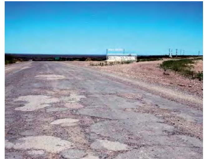
El tramo a reconstruirse de la RN 232 son 75 kms, que actualmente se encuentran muy deteriorados.