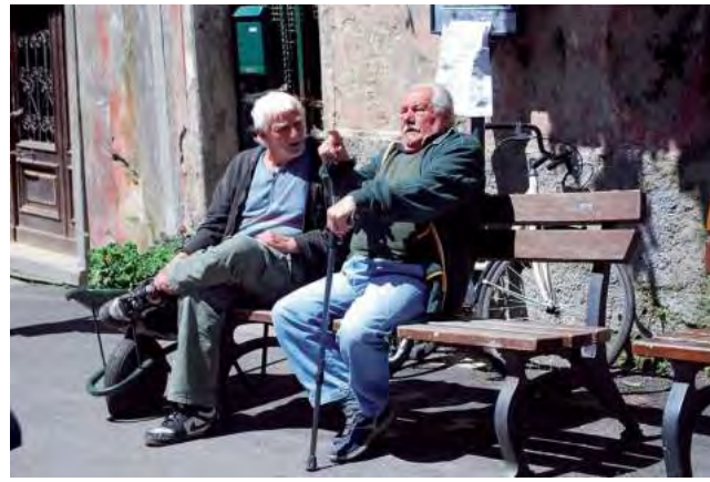
En Catania la gente mayor del lugar suele fastidiarse por la inundación de turistas. Mientras tanto la quinta parte de la población actual de Italia procede de África y un número algo menor del Asia.

Como me explicara Bruno Fiori en uno de los tantos caffè de Palermo, "nosotros hablamos con las manos por supervivencia y si no lo hacemos nos volvemos invisibles".