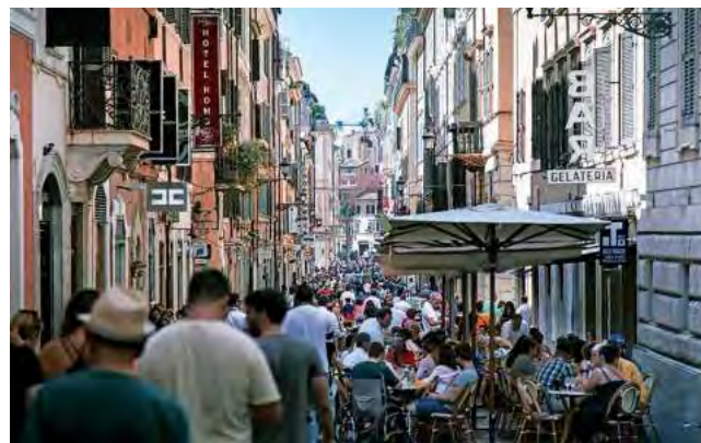
Los italianos son muchos. 59 millones en un territorio algo menor que la provincia de Buenos Aires.