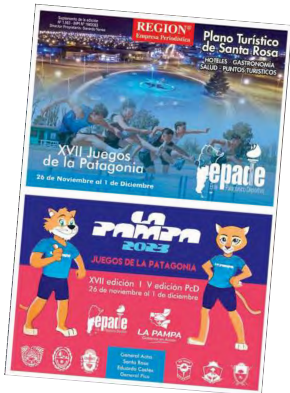
Suplemento color desplegable de REGION® para la Sede Santa Rosa, con plano turístico de la ciudad, alojamiento y gastronomía. Disponible digital por código QR.

Las sedes de competencia son Santa Rosa, General Pico, General Acha y Eduardo Castex. En Santa Rosa competirán el básquet, el fútbol masculino, el atletismo, la natación, el MTB, judo y boccia; en General Pico el fútbol femenino, en General Acha el vóley femenino y en Eduardo Castex el vóley masculino. La Pampa defenderá el título de la última edición, Santa Cruz 2022.