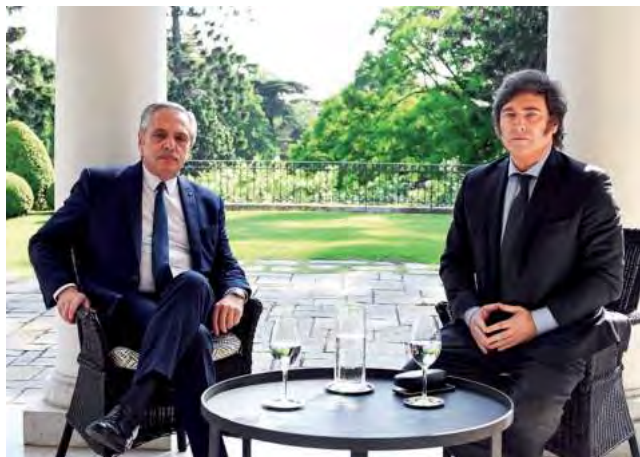
El presidente electo Javier Milei, fue el tercero en discordia, el tercio que logró romper con la polarización.

Durante el 2023 convivimos con un extenso y desgastante proceso eleccionario que debería ser examinado en toda su amplitud promoviendo reformas y calendarios electorales unificados y que simplifique la renovación del mandato que confiere el ciudadano.