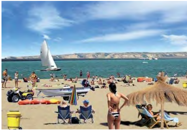
El buen nivel del lago de Casa de Piedra, renueva la esperanza de recuperar la llegada de más visitantes para esta temporada estival, como en otras épocas.