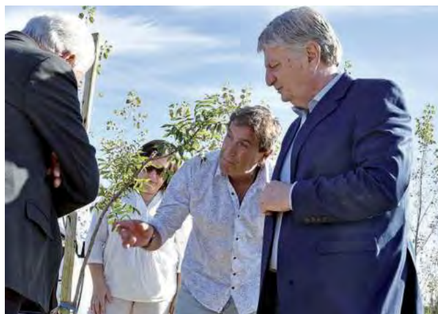
La localidad es un Polo Turístico y Productivo, donde anualmente se lanza la Vendimia Pampeana.

La Villa Turística Casa de Piedra representa el último pueblo en inaugurarse en la Provincia, exactamente el 30 de noviembre de 2006.