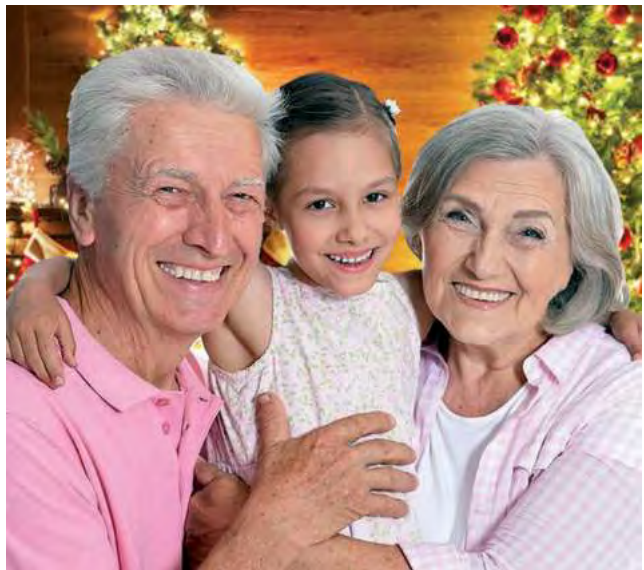
Los abuelos son los depositarios de las tradiciones familiares.

Los abuelos deberían ser los más capacitados para conocer bien a cada uno de sus hijos y a sus cónyuges y, por supuesto, a los nietos y así plantear las reuniones familiares de modo que resulten