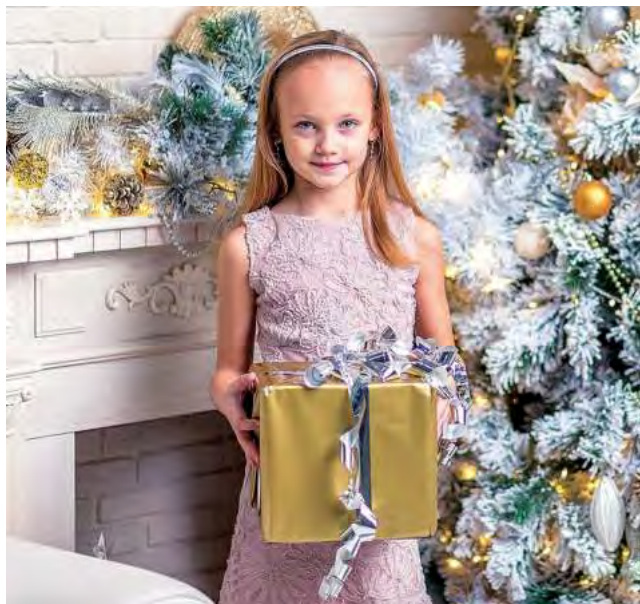
Regalar es un arte y la tarea se complica cuando hay niños de diversas edades. Siempre es conveniente consultar a los padres sobre el posible regalo.