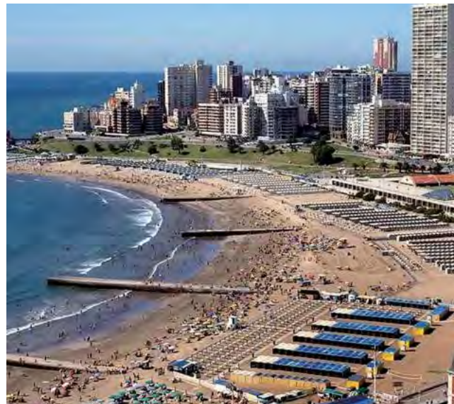
Mar del Plata, Buenos Aires y Bariloche encabezan la lista de los destinos más elegidos en Booking.com

Año nuevo, vida nueva. Acercándose la hora de despedir el 2023 y dar la bienvenida al nuevo año, muchos viajeros argentinos están listos para encarar el