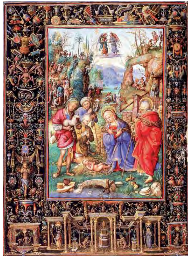
Representación de la Navidad, el nacimiento de Cristo, en una obra del año 1500.

El objetivo de esta superposición era convertir a los paganos romanos a la religión cristiana estableciendo una tradición fácilmente asimilable para ellos, ya que sería inevitablemente relacionada con algunas de sus fiestas principales celebradas en esas mismas fechas: las