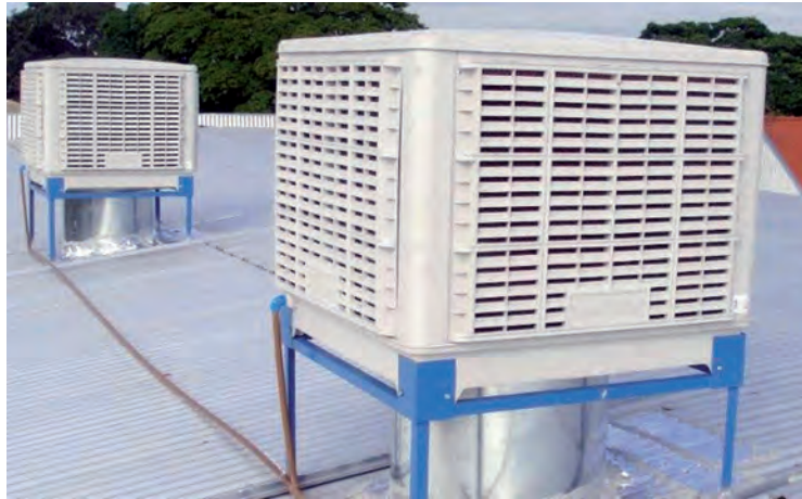
La ecoclimatización es el sistema más respetuoso con el medio ambiente

Pero además, este sistema cuenta con grandes ventajas al ser empleado en climatización con aire húmedo en grandes superficies: Es un sistema netamente