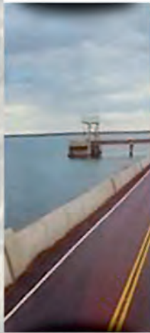
CASA DE PIEDRA