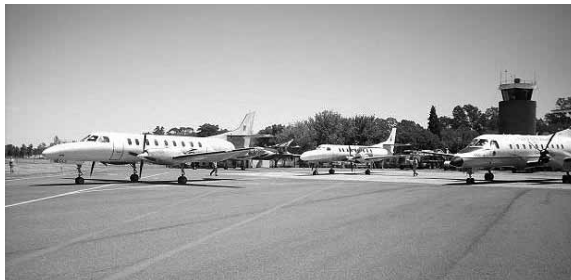
Parte de la logística DAKAR (edición 2009) en Santa Rosa, La Pampa. El operativo se repitió en 2010 y se espera nuevamente para enero de 2012.

El turismo de convenciones y cinegético demanda hotelería, gastronomía y otros servicios. Nuestro nuevo autódromo puede ayudar. La programación de fechas de las grandes categorías atrae visitantes...pero también aviones. La logística de estas carreras se apoya en el uso de aviones. Para otros eventos, la aviación es indispensable... el DAKAR sin logística aérea es imposible.