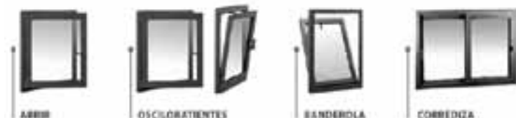
Distintas formas de abrir, cada una adaptada a la necesidad.