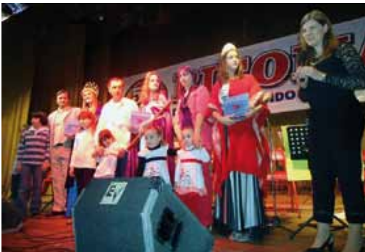
Varias reinas pampeanas y la Reina del Mar venida especialmente desde Mar del Plata, fueron agasajadas en la noche de la gran celebración.

Gente de toda la provincia y de distintos lugares del país, compartimos una noche inolvidable, donde los valores humanos fueron lo destacable y el respeto por la amistad, el ejemplo.