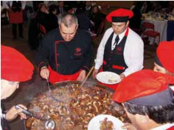
Una espectacular cazuela de mariscos, cerró la noche de comida marinera, con productos de "Picomar" y el buen servicio gastronómico de Claudio Mendoza.