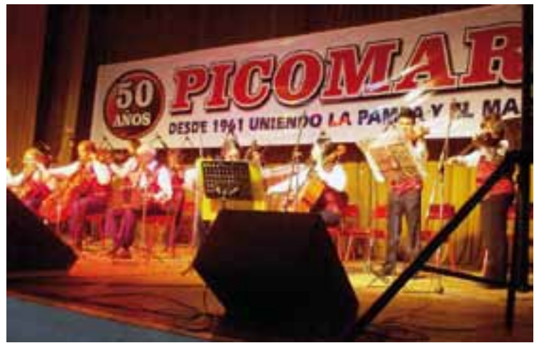
Una fiesta que empezó y terminó "a toda orquesta".