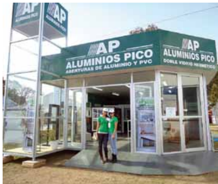
Stand de "Aluminios Pico" en la expo rural. Fue ganador del 2º Premio al mejor stand exterior en la categoría Industria.