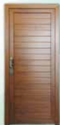
Puerta de PVC Roble

Ventana de PVC blanco, paño fijo + ventana oscilobatiente