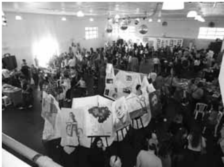
Muestra de los Talleres del Centro Cultural Maracó en la expo.

compra de maquinarias y siembra de pasturas a tasas fuertemente subsidiadas en conjunción entre el gobierno nacional, provincial y el BLP”, paralelamente dijo, “desde nuestro gobierno vamos a impulsar alternativas que permitan profundizar el proceso de recuperación del stock bovino, mediante sistemas que eviten especialmente a los pequeños y medianos productores el riesgo de pérdida de sus propiedades ante el riesgo que trasunta la toma de un crédito para esos fines”, definió.