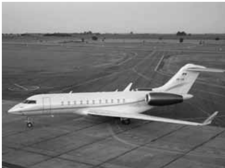
Aeronave Global Express de TIRIAC AIR, perteneciente a Ion Tiriac (ex manager de Guillermo Vilas), quien periódicamente viene de Rumania a cazar a La Pampa. En esta oportunidad solicitó la internacionalización del aeropuerto Santa Rosa y voló directamente de Recife (Brasil).