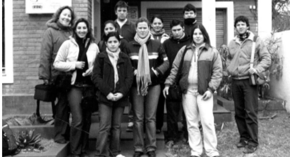
La Escuela comunicó que sigue abierta la inscripción para los Cursos de Formación Fotográfica y de Capacitación como Docente. Para el interior de la provincia hay cursos preferenciales, consultar llamando al tel: (02954) 414-333, ó personalmente en Alem 330, Santa Rosa.