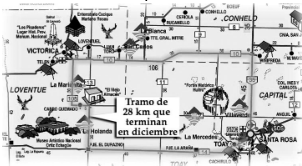
El circuito involucra la conexión pavimentada entre Santa Rosa -ciudad cabecera de servicios e infraestructura desde donde se distribuyen destinos- y las estancias turísticas La Mercedes, La Holanda, La Marianita, San Carlos, La Blanca y Villaverde.

El cuarto desde este último punto hasta tomar contacto con la Ruta Nacional N° 152, conectando a toda esta zona productiva ganadera con salida a los centros de venta como General Acha, Santa Rosa, etc., pero generando además, un corredor turístico que pue-