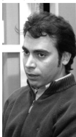
CaTuLPa confió al Estudio «DigiSapiens» la realización de su nueva página Web.

Workshop en Santa Rosa También se habló de detalles de organización del Programa «Argentina para Argentinos» y el 1er Workshop de comercialización a realizarse en La Pampa el próximo 10 de octubre, organizado por la Cámara Argentina de Turismo y CaTuLPa, que tendrá características similares al último llevado a cabo en la ciudad de Comodoro Rivadavia el mes pasado (ver aparte).