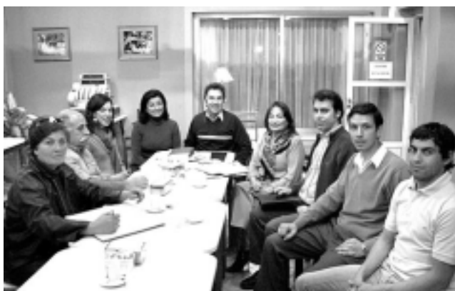
La Cámara trabaja activamente en la organización del Programa «Argentina para Argentinos» y el 1er Workshop de comercialización a realizarse en La Pampa el próximo 10 de octubre, organizado por la Cámara Argentina de Turismo y CaTuLPa.

La Red Rural de la Cámara de Turismo de La Pampa, participará este miércoles 12 de septiembre en el Workshop de Turismo Rural de la SecTur en Buenos Aires, donde también se presentará la Subsecretaría de Turismo de La Pampa. Así lo informaron directivos de CaTuLPa durante una reunión realizada la semana pasada en el céntrico salón del Hotel San Martín de Santa Rosa. También confirmaron la participación de la Cámara Pampeana en el Encuentro de Comercialización y Presentación «Toda la Argentina en Buenos Aires» (ver aparte), que organiza anualmente FedeCaTur, previsto para el 3 de octubre en el Hotel Panamericano.