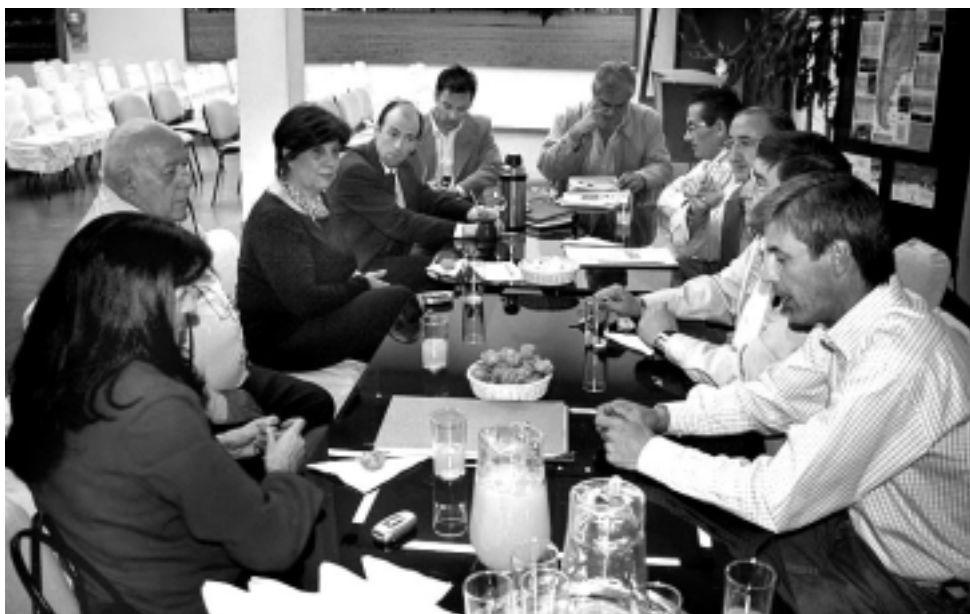
Tanto la subsecretaria de Turismo, como el director de Turismo Municipal y el presidente de la Cámara Inmobiliaria, coincidieron con la Asociación Hotelera y la Cámara de Turismo, en la necesidad de impulsar cuanto antes una nueva legislación sobre Alojamientos Turísticos.

Una nueva reunión en la Subsecretaría de Turismo, sentó en la mesa de conversaciones a la subsecretaria y técnicos del área, al director de Turismo Municipal de Santa Rosa, integrantes de la Asociación Empresaria Hotelera Gastronómica, de la Cámara de Turismo y al presidente de la Cámara Inmobiliaria. El tema tratado fue una vez más, el de lograr un avance en obtener una nueva legislación sobre Alojamientos Turísticos, ya que las normas vigentes tienen 30 años de antigüedad y las realidades del mercado y especialmente del Turismo en la provincia, han cambiado y mucho.