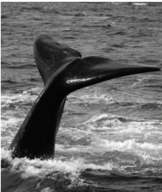
En Península Valdés entre numerosas especies de aves y mamíferos marinos, costeros y terrestres, se pueden avistar las ballenas francas australes, y también elefantes y lobos marinos y los pingüinos de Magallanes.

Pero no todo es ballenas y nada más, conocer la maravi-