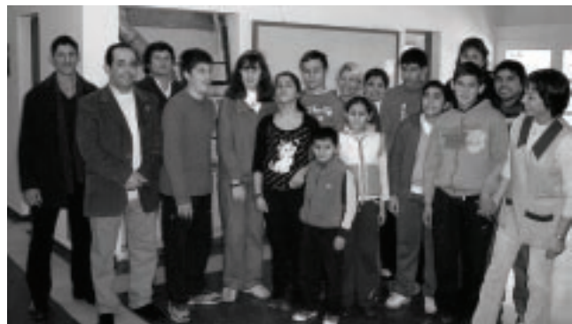
Fioma junto a sus compañeros, socios del Club Rotario Santa Rosa Sur y directivos de la escuela

Una distinción que, necesariamente, requiere de un testimonio material y personal, pero que en su significación, creemos, debe hacer sentir como partícipes a todos los que, en medio de una realidad social que lamentablemente, cada día lo hace más difícil, guían a Fioma y a los compañeros de su realidad cotidiana a reconocer el valor del esfuerzo que hoy necesariamente les pide su justa aspiración a concretar futuras metas dignas, mediante acciones y conductas que, como la que motiva este reconocimiento, nos llene de satisfacción y esperanzas».