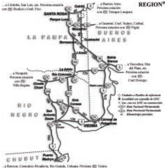
«Hoja de Ruta» del Suplemento N° 13 de REGION®.